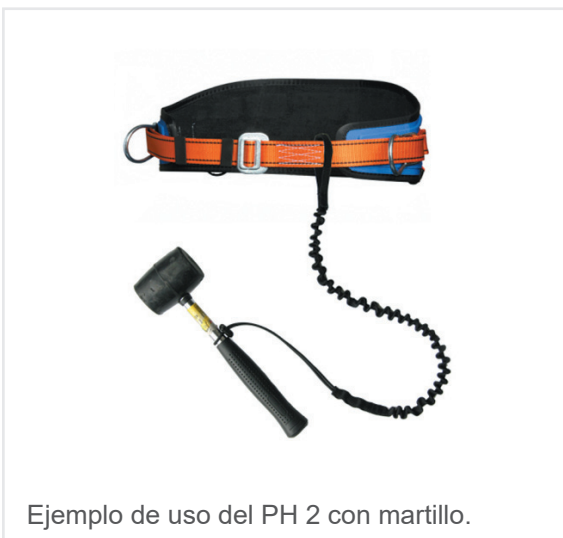
Ejemplo de uso del PH 2 con martillo.