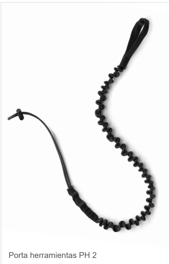
Porta herramientas PH 2