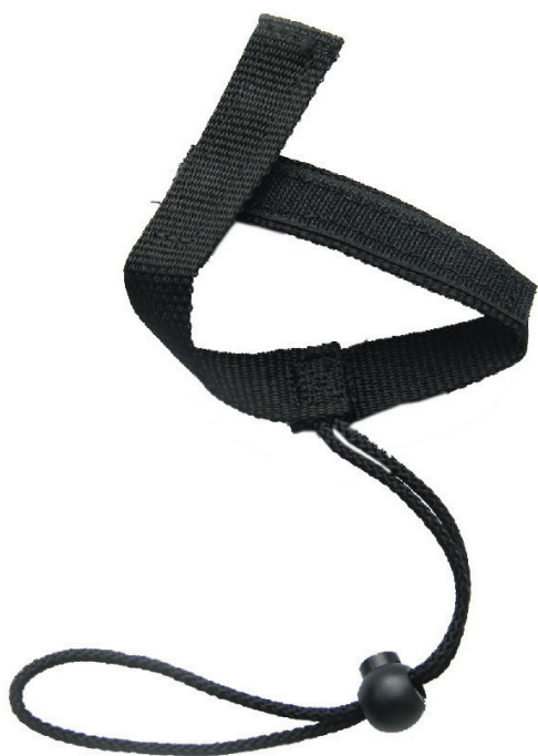
Porta herramientas PH 1