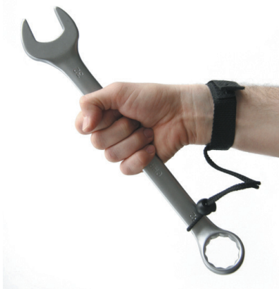
Ejemplo de uso del PH 1 con llave.