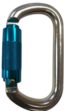
Conector desmontable. Mosquetón AA012T