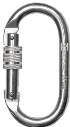
Conector desmontable. Mosquetón AA011 (N-244-O)