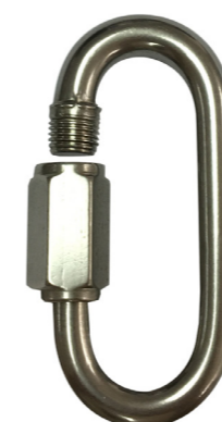
Conector desmontable. Mosquetón AA111