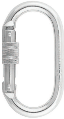
Conector desmontable. Mosquetón AA011 INOX