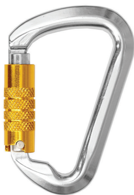
Conector desmontable. Mosquetón AA014T (N-272)